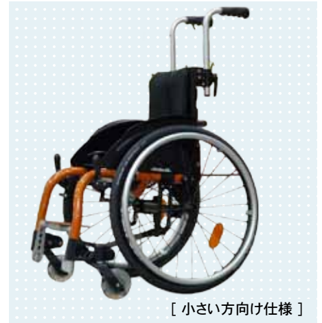
[ 小さい方向け仕様 ]